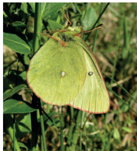
Žluťásek borůvkový z boku