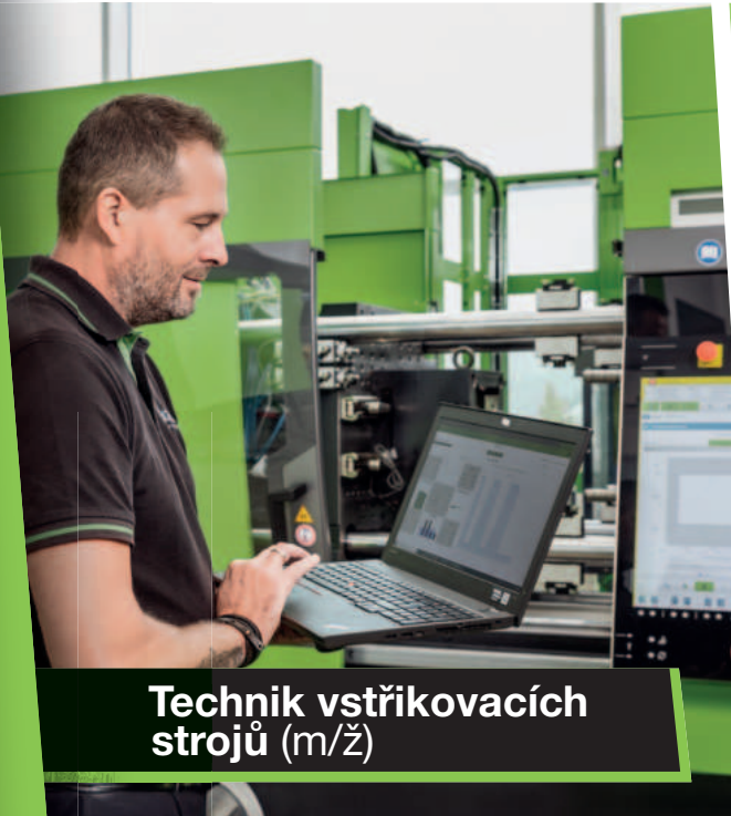
Technik vstřikovacích strojů (m/ž)

A staň se součástí světové jedničky ve výrobě vstřikovacích strojů.