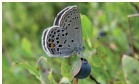
Modrásek stříbroskrvný bok