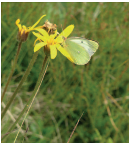
Žluťásek borůvkový samička