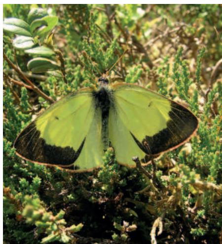
Žluťásek borůvkový sameček