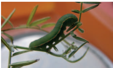
Žlutásek čilimníkový housenka