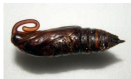
Lišaj svlačcový kukla