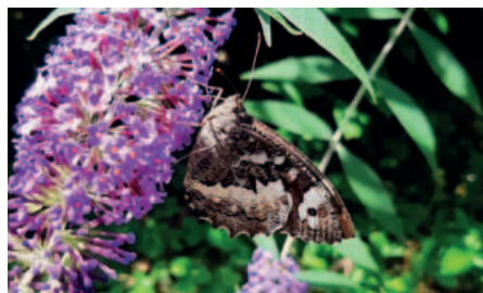
Okáč voňavkový rub