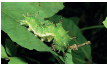
Bělopásek dvouřadý housenka