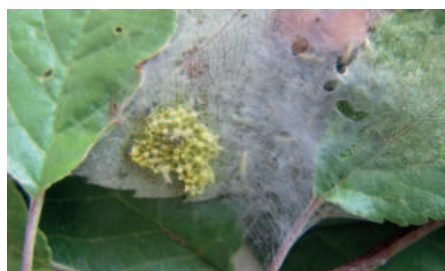
Bělásek ovocný vajíčka