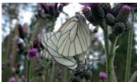
Bělásek ovocný pár