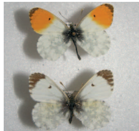
Bělásek řeřichový pár