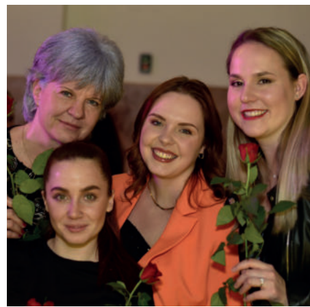
kompletní fotogalerii najdete na webu obce