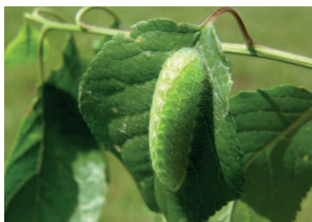
Ostruháček březový housenka