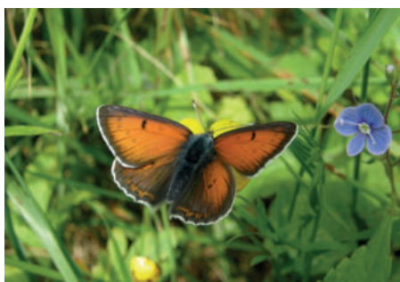
Ohniváček modrolelý sameček