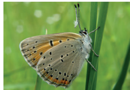
Ohniváček modrolelý bok