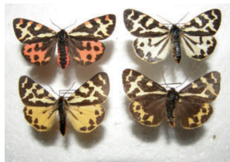
Přástevník jitrocelový formy