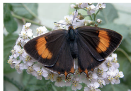
Ostruháček březový samička