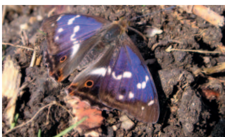
Batolec červený sameček