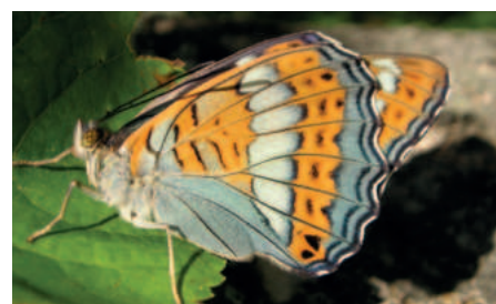
Bělopásek topolový bok