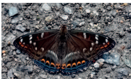
Bělopásek topolový sameček