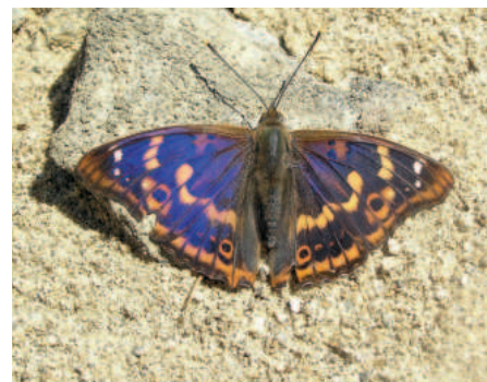
Batolec červený sameček f. žlutá