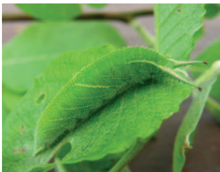
Batolec duhový housenka