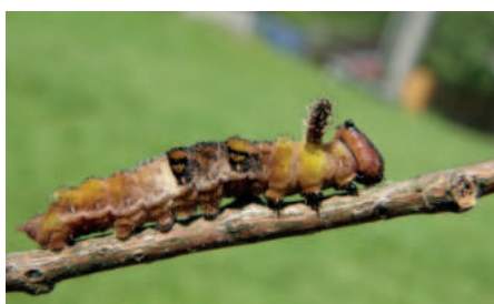
Bělopásek topolový housenka