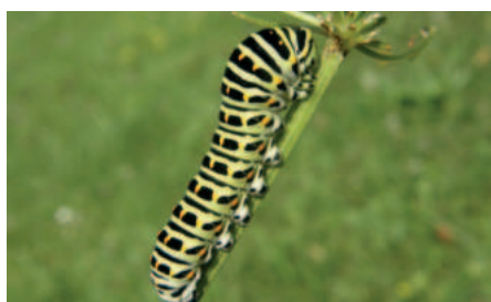
Otakárek fenyklový housenka