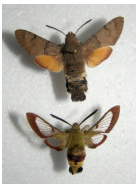
Dlouhozobka svízelová, zimolezová