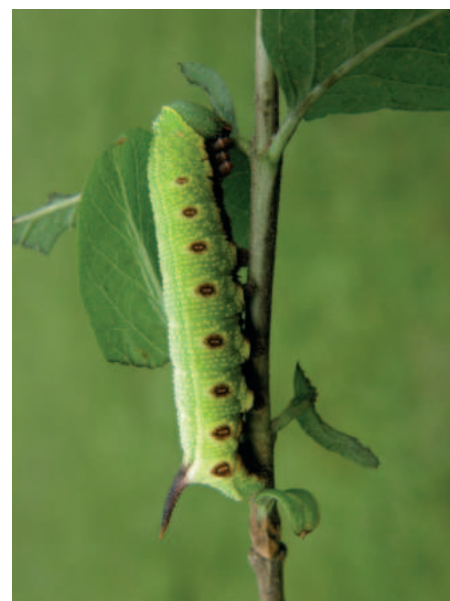
Dlouhozobka zimolezová housenka