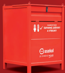
kovová nádoba* 80 × 80 × 115 cm