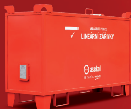
kovová nádoba* 160 × 50 × 80 cm